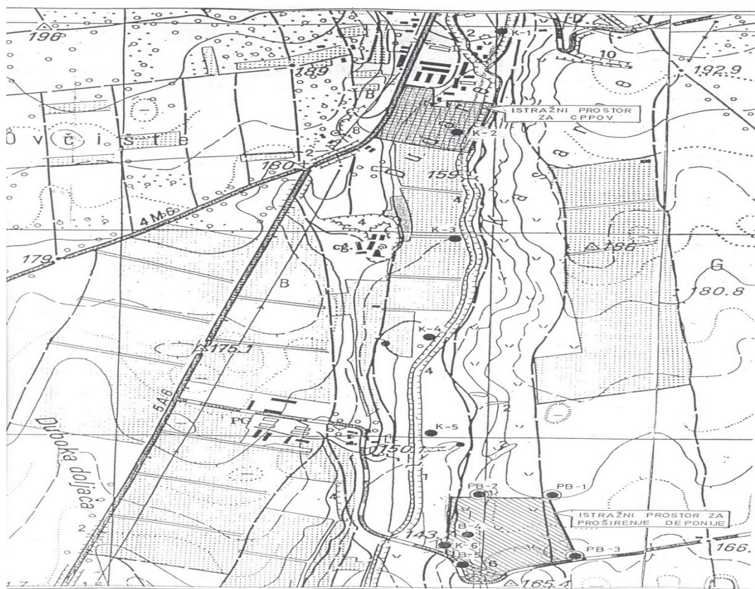
Слика 4. Депонија општине

Кроз депонију је пролазни приступни пут са чије леве и десне стране се одлаже отпад. Пут је неасфалтиран, земљани те је при лошим временским условима отежан пролаз камиона.