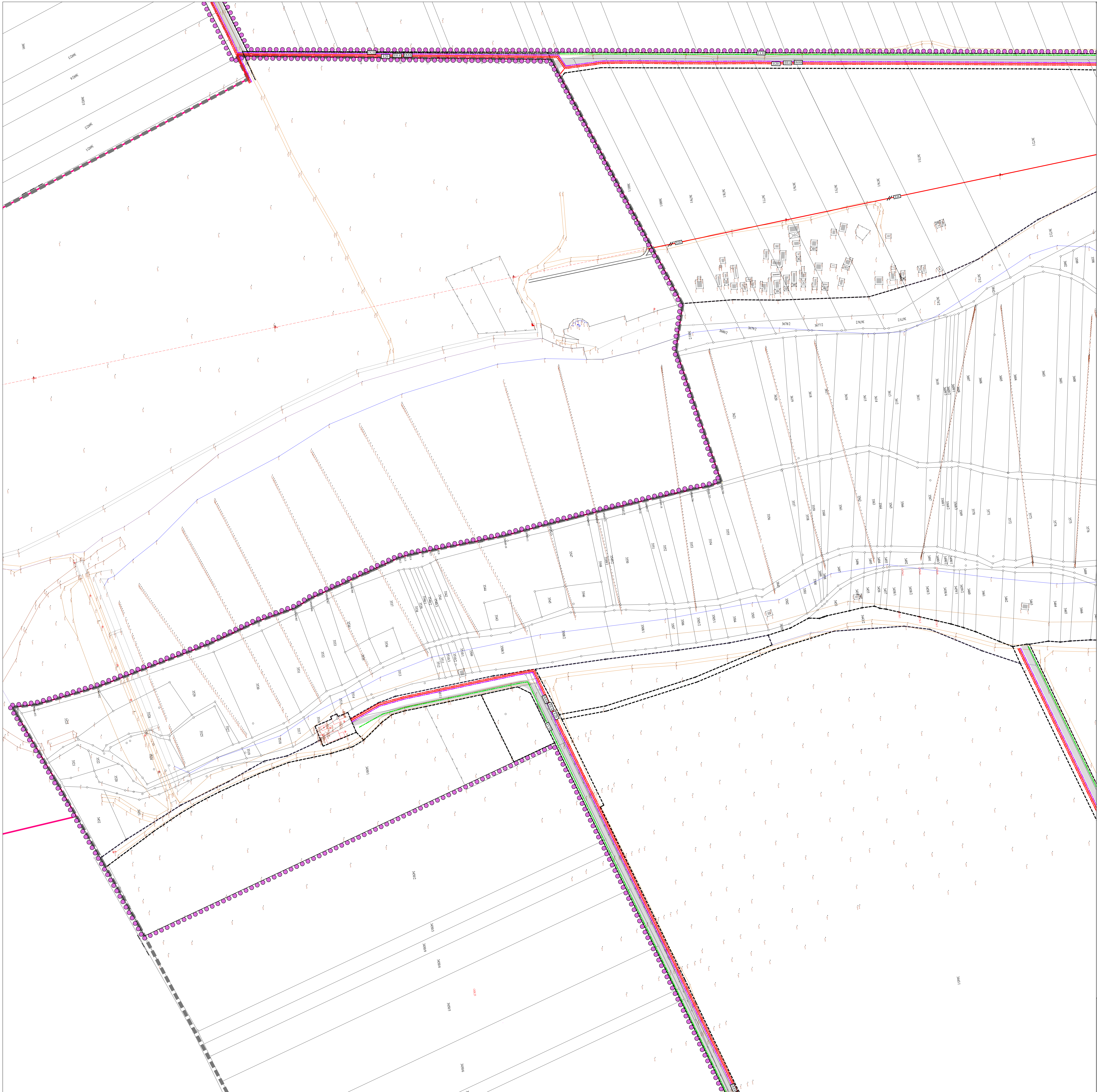
ЕНЕРГЕТСКА И ЕК ИНФРАСТРУКТУРА - ЛИСТ 8